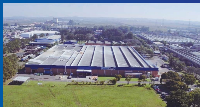
Planta industrial Midea Carrier, localizada em Canoas/RS

A planta industrial de Canoas é, hoje, uma das maiores e mais modernas fábricas do grupo Carrier no mundo. Destaca-se pelo centro de engenharia e pesquisa, que constantemente investe no desenvolvimento de novas tecnologias que tornam os produtos da Midea Carrier cada vez mais inovadores, eficientes, econômicos e ambientalmente sustentáveis.